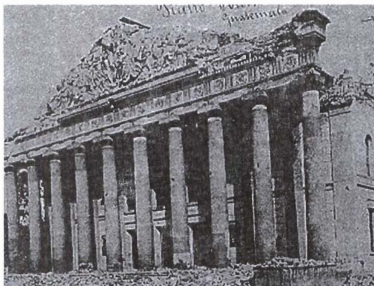
Teatro Colón después del terremoto.

tablas separan a los ricos de los pobres". 39 Naturalmente no se terminaron las diferencias sociales, la ciudad estaba poblada en su mayor parte por indios y ladinos pobres. Los mestizos se ocupaban de los oficios públicos y la política. En la cumbre de la pirámide, una pequeña élite nativa y extranjera dominaba la sociedad en su conjunto. 40 Lo que en realidad se despertaba entre los capitalinos era un sentimiento de solidaridad humana y de igualdad de condición frente al desastre.