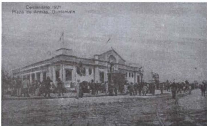
Plaza de Armas.