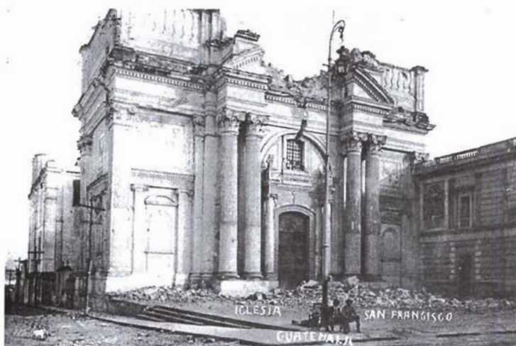
Iglesia de San Francisco.

La Dirección de Obras Públicas extendió sus labores de descombración y reconstrucción en 1922. En octubre las cuadrillas de esta dependencia se encontraban reconstruyendo el Instituto Nacional de Señoritas, la Escuela de Artes y Oficios, la Casa de Recogidas, el Conservatorio de Música, la Casa de la Moneda, el Instituto Nacional de Varones y los Almacenes de Obras Públicas. La labor de descombración se realizaba en el Teatro Colón, la iglesia de San Francisco, los parques Central, Morazán y Concordia, la Escuela Nacional de Indígenas, la Escuela de Agricultura, los Almacenes de Fomento, la Guardia de Honor y la Escuela de Guajitos. 51 Aparentemente, en la medida que el Decauville Nacional se orientaba hacia la transportación de pasajeros, la