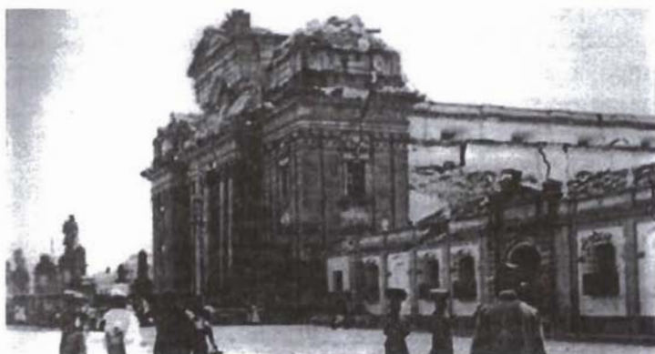
Catedral destruida por el terremoto.

en la 9a. avenida de la actual zona 1. 23 Al finalizar aquella semana, el viernes 14 de junio, el responsable de la empresa agradeció al Ministro de Fomento su constante supervisión de los trabajos de descombración, agregando que esto le dio la oportunidad de reportar diariamente sus actividades. Esa semana se terminó de tender la última línea principal sobre la 4a. avenida sur hasta la 5a. calle, con el objeto de iniciar la limpieza el siguiente lunes. El Ministro de Estrada Cabrera había ordenado también la descombración del Instituto Nacional de Varones y de la Escuela de Derecho, edificios contiguos. Anguiano, pensando siempre en rebajar la planilla de la empresa, sugirió que la cuenta de la descombración de estos establecimientos educativos fuera remitida al Ministerio de Instrucción, tanto de peones como de aceite para las locomotoras. De la misma manera que se había actuado con la limpieza de la Catedral. 24