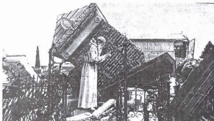
Cementerio General después del terremoto.

Sin embargo, y pese a los esfuerzos de la Empresa Nacional de Descombración, aún un mes después, el 10. de diciembre, las cuadrillas estaban empeñadas en tareas dentro del Cementerio General. Se informó que ese día habían quedado concluidos los cuadros 9, 10 y 11, y que las cuadrillas habían tendido líneas para evacuar los escombros de los dos últimos. Se levantaron además las líneas muertas y se tendieron nuevas. Los carpinteros habían trabajado sábado y domingo con el objeto de terminar un puente necesario para botar el ripio. 46 A estas alturas,