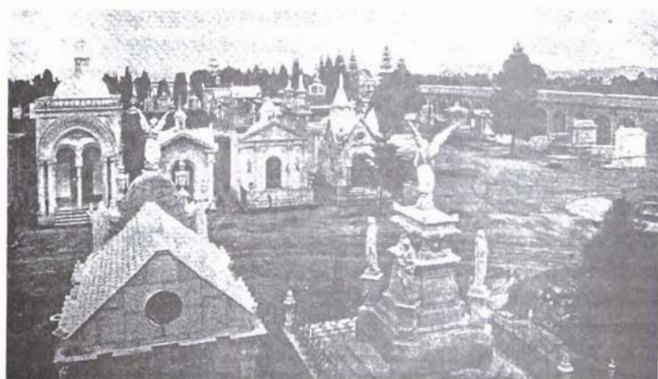
Cementerio General.

El Cementerio General recibió especial cuidado de parte de los sectores dominantes de la sociedad guatemalteca. Situado al occidente de la capital, ocupaba un área de 320,000 metros cuadrados, no incluyendo el terreno rodeado de barrancos y unido al campo principal por un puente llamado "La Isla", de 800 metros de frente por 400 de fondo. Se podía encontrar en un cementerio, indica José Flamenco, "infinidad de elegantes y suntuosos monumentos, capillas, columnas y mausoleos, de variada y caprichosa arquitectura". 22 En 1915, se encontraban construidos 699 mausoleos de primera clase, 853 de segunda