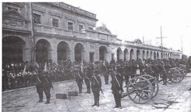
Palacio de los Capitanes.

realizaron múltiples desfiles de escolares y militares, empezando el 5 de septiembre y culminando el día 20. El nuevo Hipódromo del Sur se convirtió en el punto principal de atracción, ya que en sus inmediaciones además se montaron pabellones para exposiciones. La exposición ganadera se llevó a cabo en el Campo de Marte. El Presidente Carlos Herrera era uno de los principales criadores de ganado del país. La fiesta popular se realizó en los llanos del Tívoli con mucha animación, marimbas y juegos pirotécnicos. 41 Los universitarios realizaron el Congreso Panamericano de Estudiantes, con representantes de toda América, incluyendo los Estados Unidos. Este evento se inauguró el 12 de septiembre y, entre los oradores, hubo un