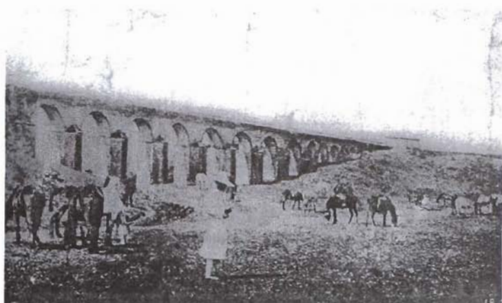
Acueducto de la ciudad.

Los servicios con que contaba la ciudad, indicó Winter, eran buenos. El agua llegaba por dos acueductos; su abundancia y calidad eran notables y era distribuida en fuentes públicas con facilidades para lavandería. La ciudad estaba bien iluminada con luz eléctrica y el servicio telefónico era aceptable. El tranvía de tracción animal era barato y brindaba un servicio necesario a la población.