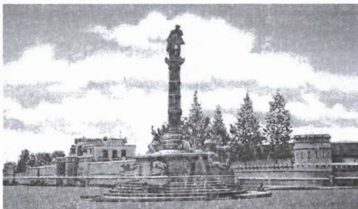
En primer plano, el monumento a Miguel García Granados, al fondo, la Academia Militar.

de los responsables de la descombración. Los seguidores del partido marcharon de 8 en fondo sobre la avenida de La Reforma hasta la sede de la Academia Militar, donde se realizaban las deliberaciones de ese organismo. Estrada Cabrera se preparó para darles una recepción