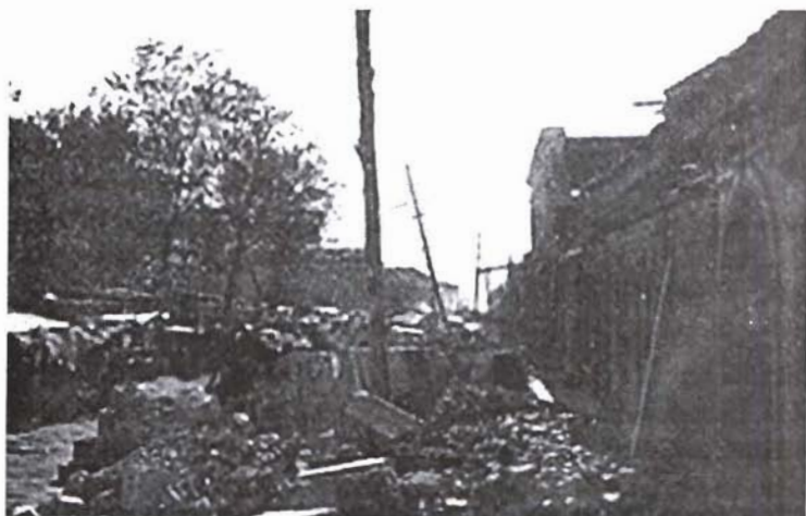
Campamento después del terremoto.