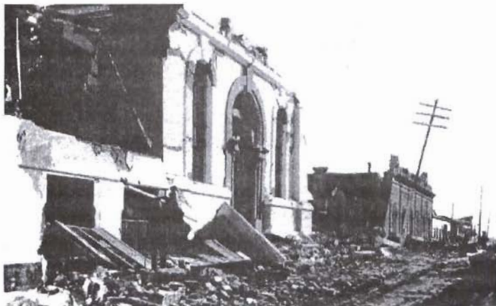
Casas particulares.

En junio de ese año, se tomaron precauciones para proteger las maquinarias en la época lluviosa. Se trasladó una galera que se encontraba frente a la penitenciaría para unirla a la de la 12 avenida sur, que había servido anteriormente como estación del Decauville. 25