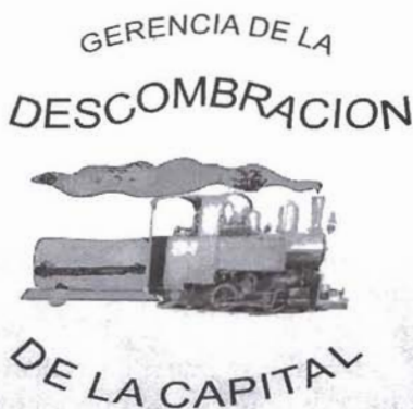
Logotipo de la Gerencia de la Descombración de la Capital.